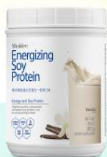
精沛素低脂大豆蛋白