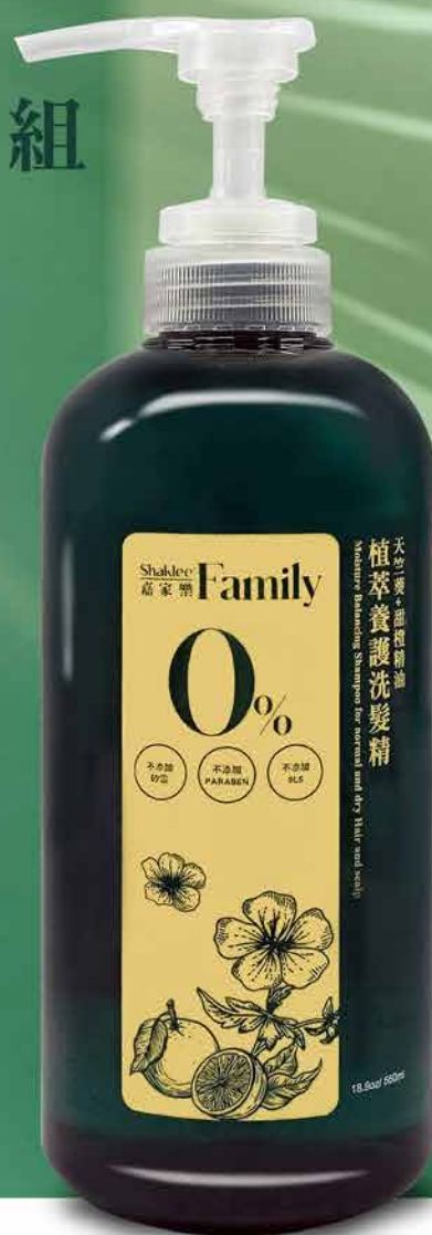
植萃養護洗髮精 天竺葵+甜橙精油