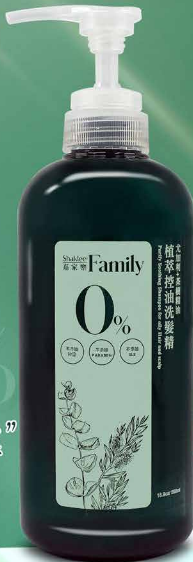
植萃控油洗髮精 尤加利+茶樹精油